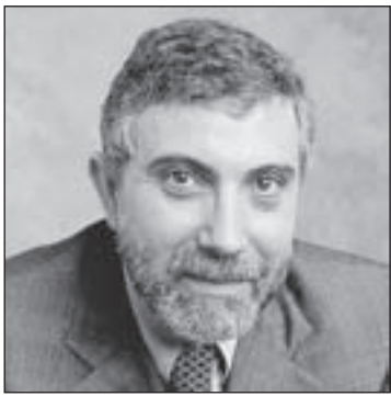
PAUL KRUGMAN © 2011 New York Times

It's time to start calling the current situation what it is: a depression. True, it's not a full replay of the Great Depression, but that's cold comfort. Unemployment in both America and Europe remains disastrously high. Leaders and institutions are increasingly discredited. And democratic values are under siege.